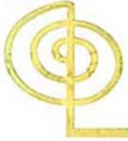
MODEL F-1 CHOKUREI