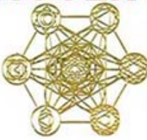
MODEL B-1 METATRON