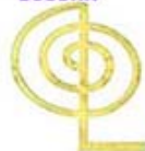
MODEL F-2 CHOKUREI