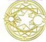
MODEL I-2 SOLAR MOONSHINE DAVID STAR