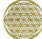
MODEL J-2 FLOWER OF LIFE

CHOIX DES MOTIFS POUR TOUS LES MÉDAILLONS ORGO-LIFE CHOICE OF PATTERNS FOR ALL ORGO-LIFE MEDALLIONS