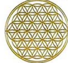
MODEL J-1 FLOWER OF LIFE