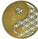
MODEL G-2 YIN YANG FLOWER OF LIFE