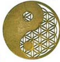
MODEL G-1 YIN YANG FLOWER OF LIFE