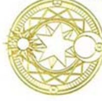
MODEL I-1 SOLAR MOONSHINE DAVID STAR